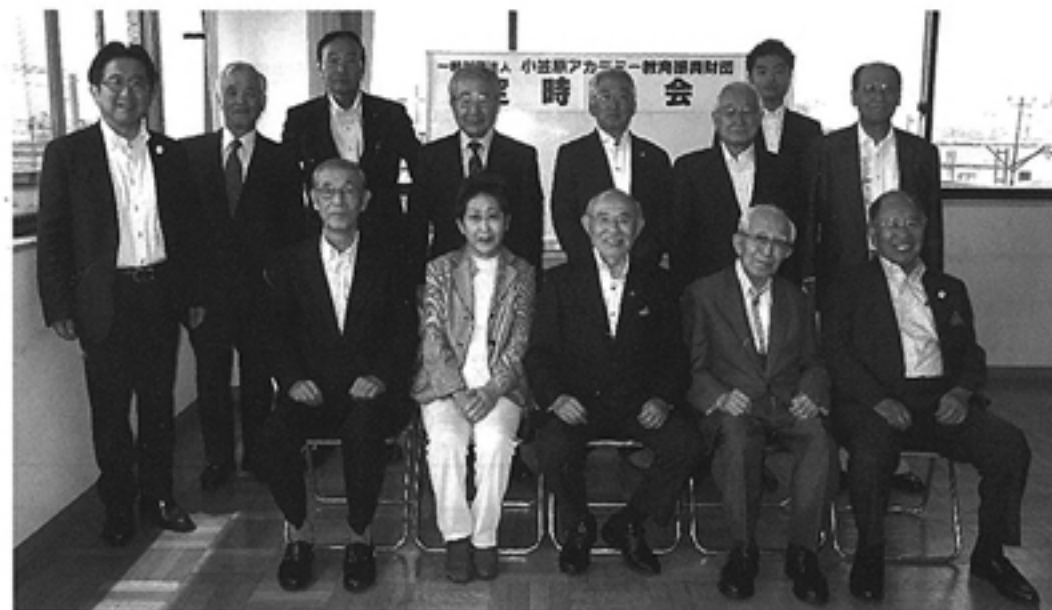
令和元年度 定時総会 2019・7・18 函館新聞社ビル会議室に於いて