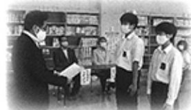
浜分中学校・生徒会代表