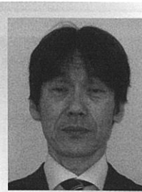
北海道教育庁 渡島教育局長 谷垣 朗