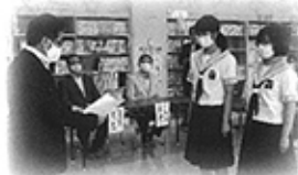
湯川中学校・生徒会代表