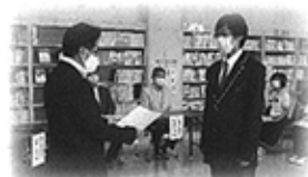
七飯町立大沼岳陽学校